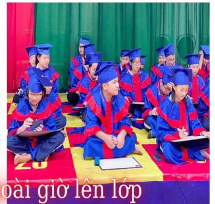
Hoạt động ngoài giờ lên lớp