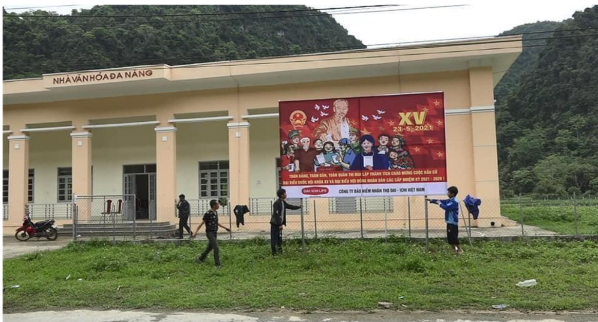
Ảnh 7. Xây mới nhà văn hóa đa năng xã Yên Thắng năm 2019