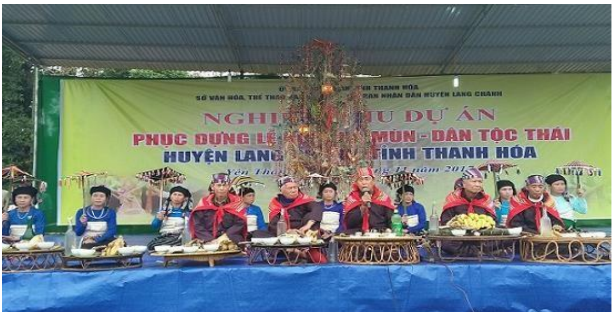
Ảnh 5. Lễ phục dựng Lễ hội Chá Mùn xã Yên Thắng, huyện Lang Chánh