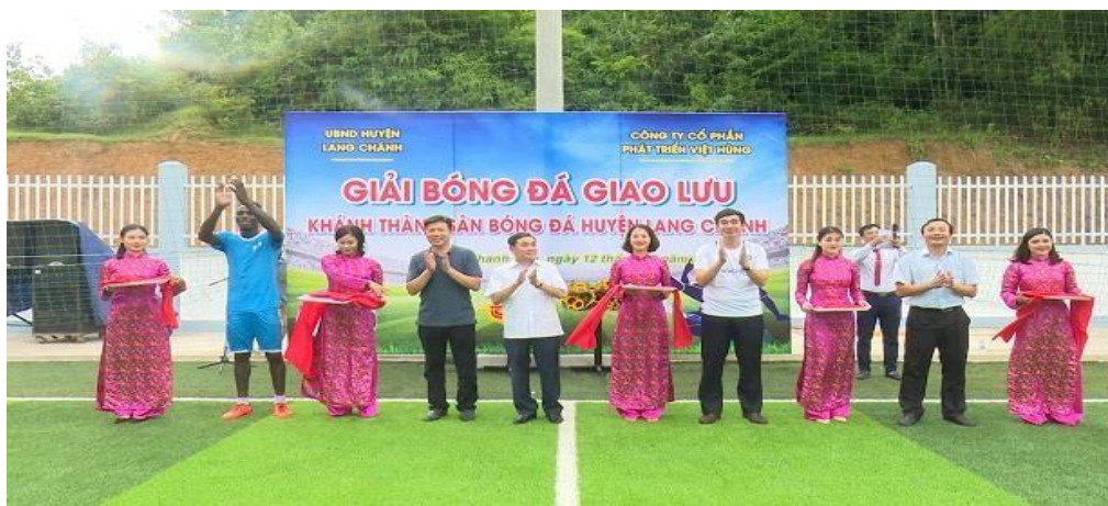
Ảnh 2. Sân vận động huyện Lang Chánh được nâng cấp năm 2020