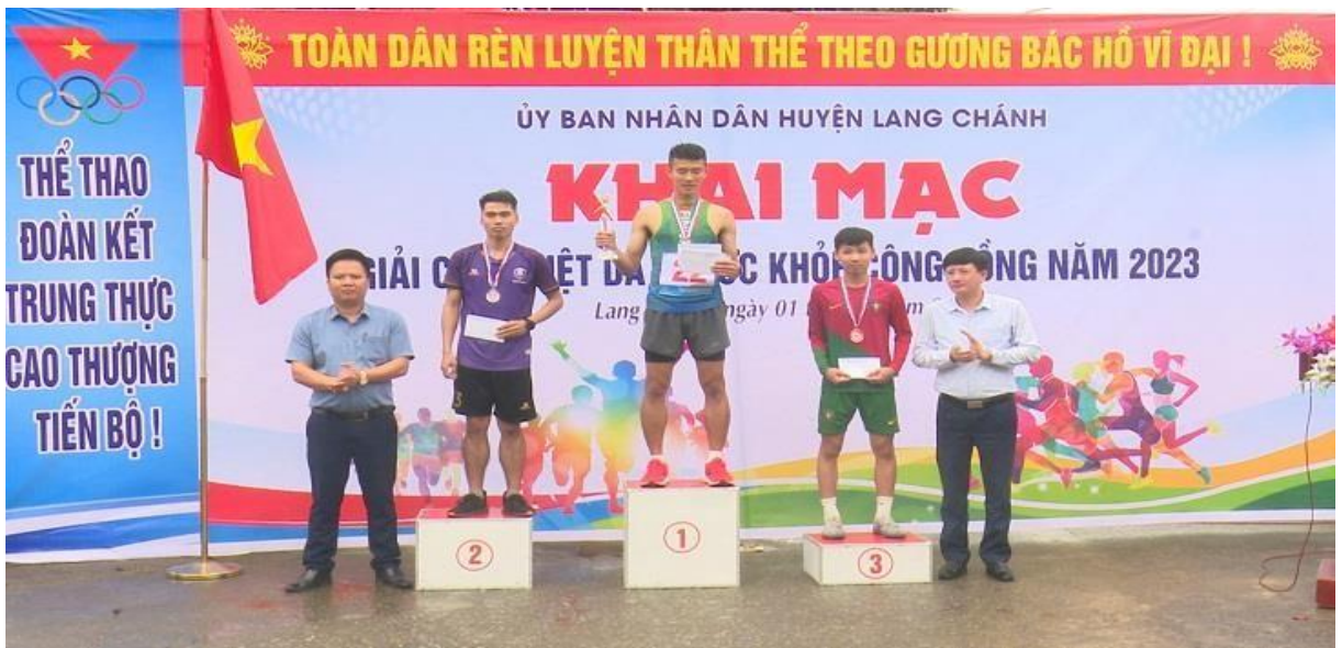
Ảnh 6. Ngày chạy Olympic vì sức khỏe toàn dân huyện Lang Chánh năm 2023