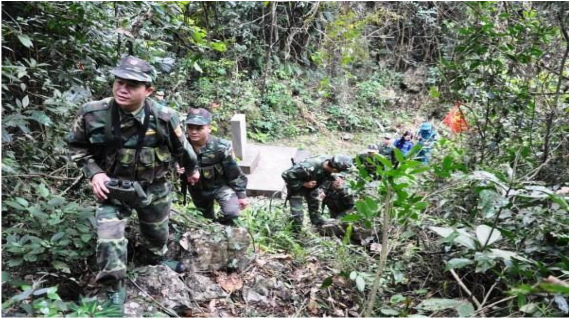
Ảnh 4. Cán bộ, chiến sĩ Đoàn Biên phòng Yên Khương phối hợp với nhân dân tuần tra, bảo vệ biên giới