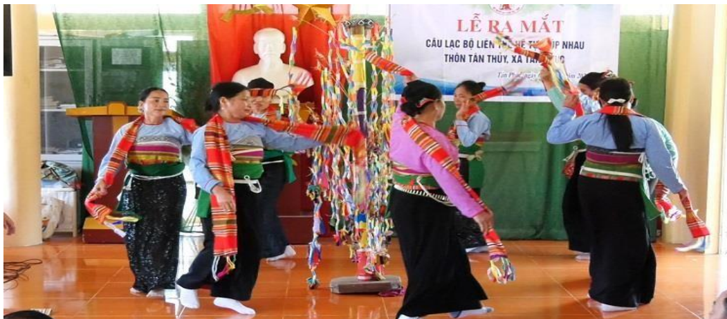
Ảnh 1. Lễ ra mắt CLB Liên Thế Hệ thôn Tân Thủy, xã Tân Phúc, huyện Lang Chánh