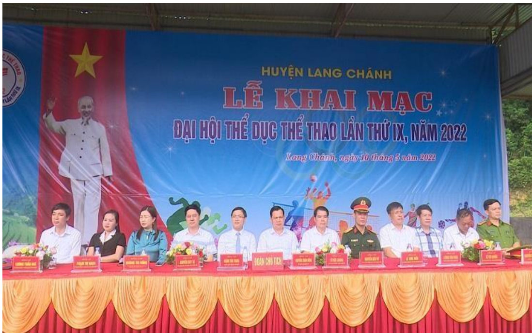
Ảnh 4.4. Đại hội Thể dục thể thao huyện Lang Chánh lần thứ IX năm 2022