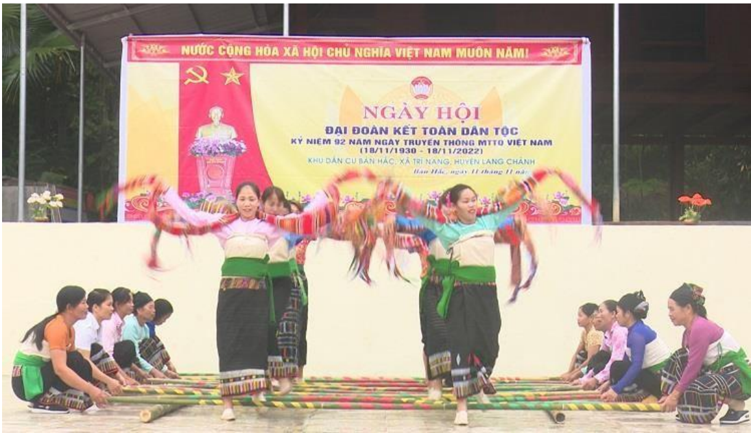
Ảnh 3. Ngày hội Đại đoàn kết toàn dân tại bản Hắc, xã Trí Nang