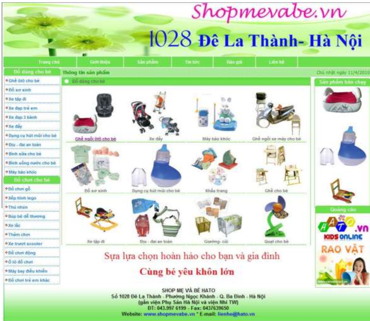
Hình 4. Trang web Shop Mẹ và Bé.