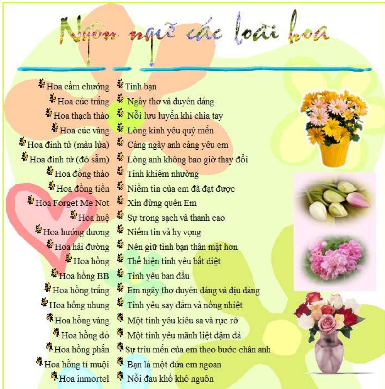
Hình 2. Trang web Ý nghĩa các loài hoa.

Thêm một trang web mới và đặt tên là baitap2.htm và thiết kế như hình 2. Dữ liệu hình ảnh và nội dung (file ynghialoaihoa.docx ) được lưu trong thư mục BT2_Y nghĩa loại hoa