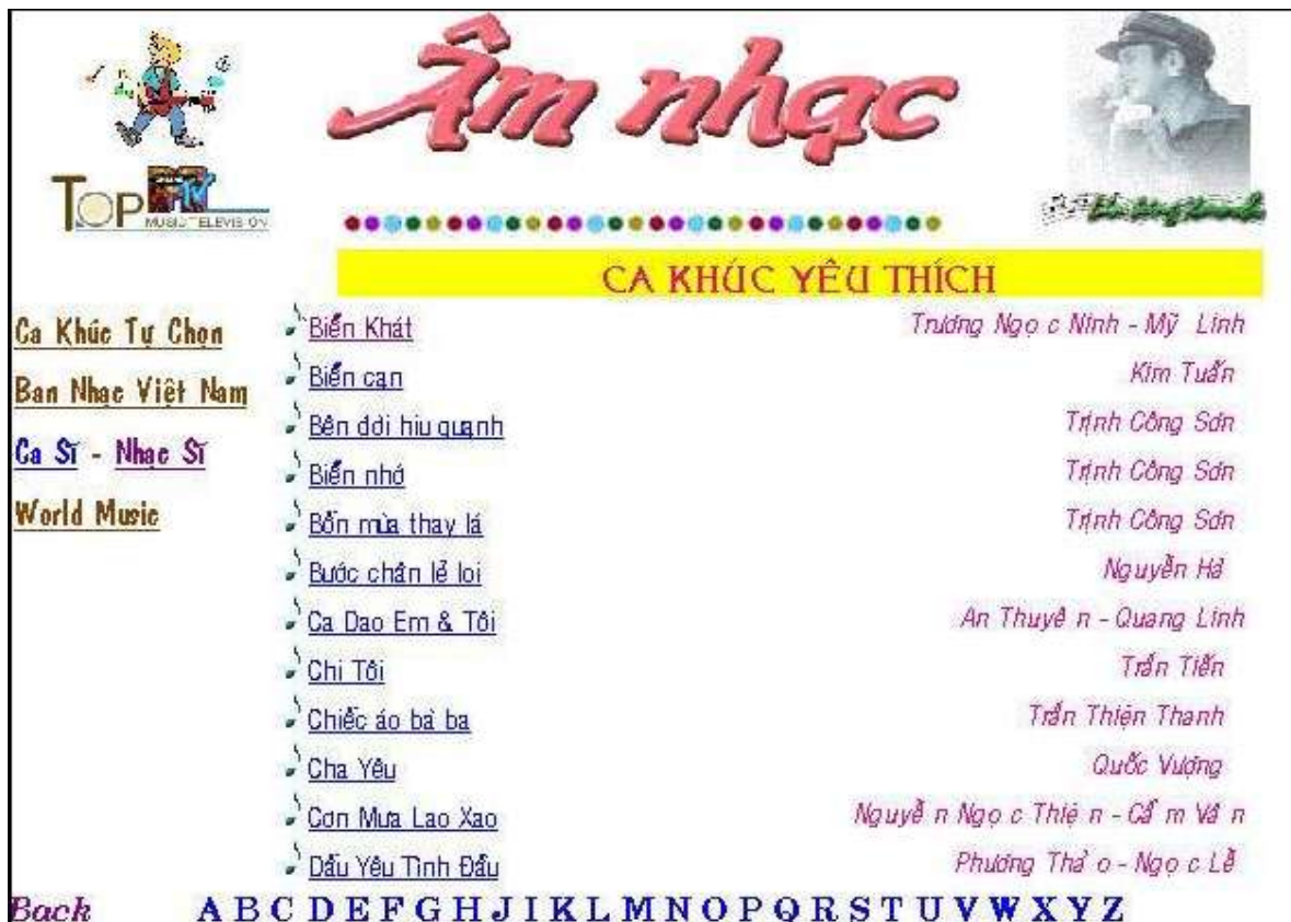
Hình 6. Trang web Âm nhạc.