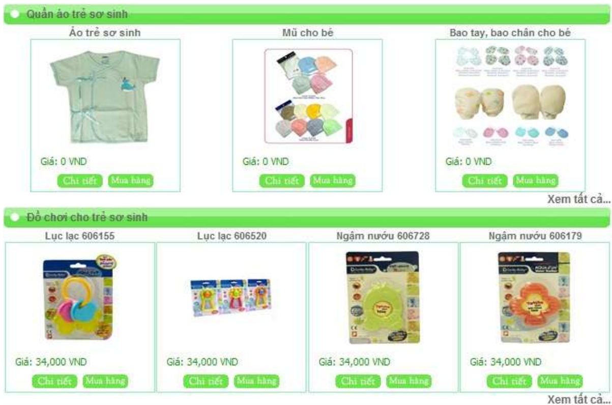
Hình 5. Trang web Quần áo trẻ sơ sinh .