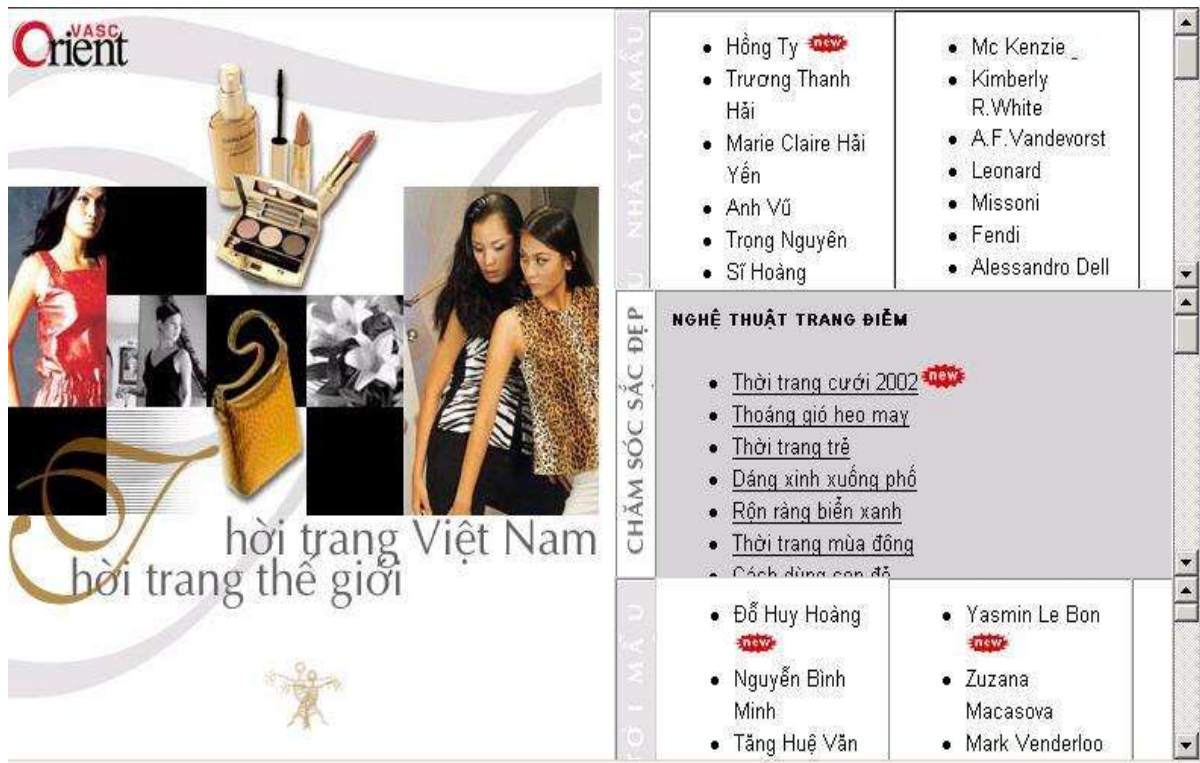
Hình 7. Trang web Thời trang Việt Nam.