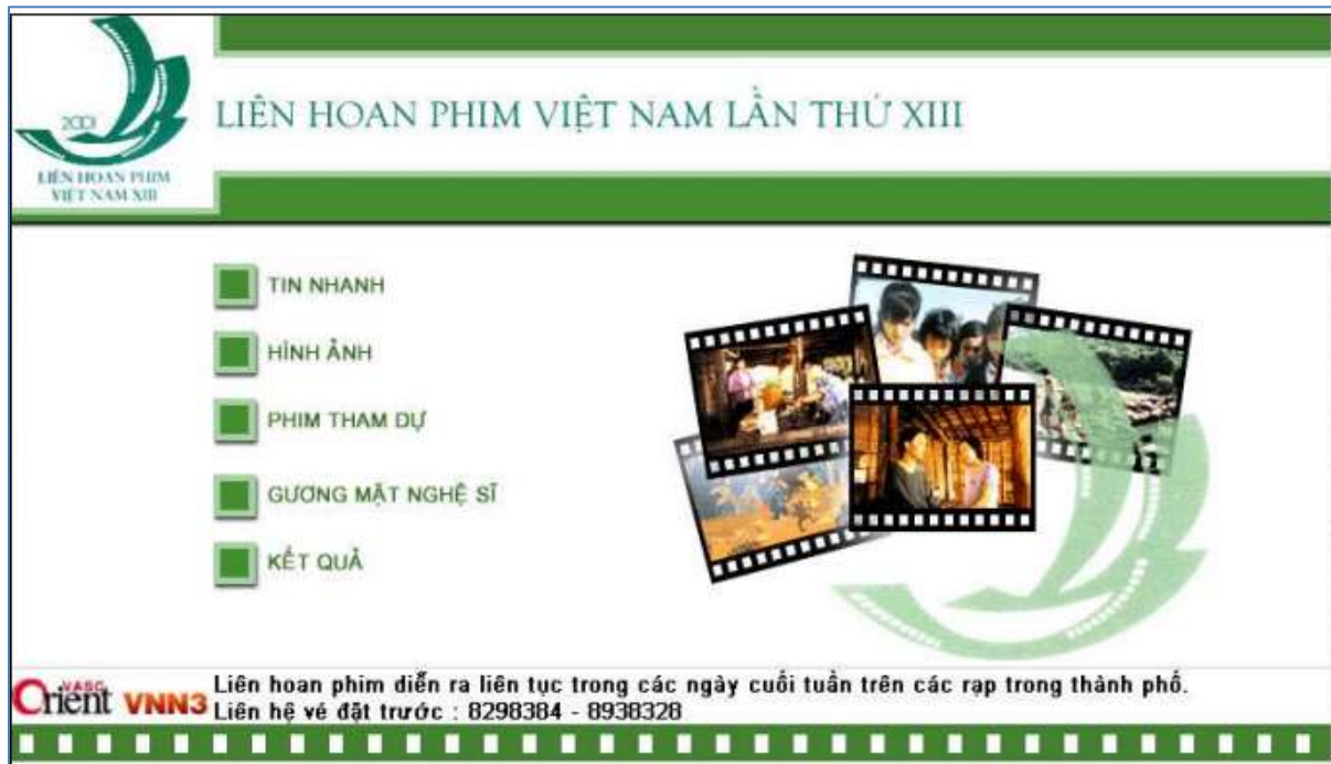
Hình 3. Trang web Liên hoan phim Việt Nam.

Thêm một trang web mới và đặt tên là baitap3.htm và thiết kế như hình 4. Dữ liệu hình ảnh được lưu trong thư mục BT3_Lien hoan phim Viet Nam