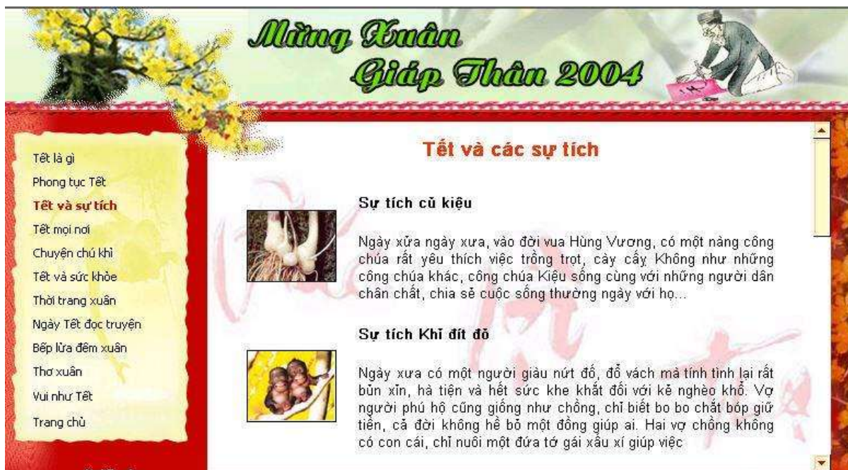
Hình 8. Trang web Tết Việt Nam.